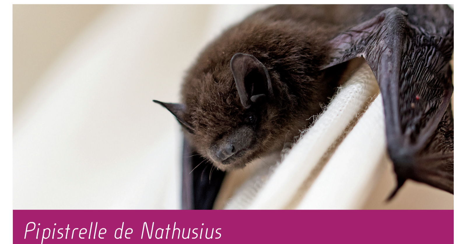
Pipistrelle de Nathusius

La Noctule commune et la Pipistrelle de Nathusius sont des espèces détectées au sein du périmètre final et très sensibles aux éoliennes, surtout en raison de leurs comportements migrateurs. Les axes de migration de ces Chiroptères sont en général peu connus. Quelques observations semblent indiquer l'utilisation préférentielle des vallées. Néanmoins, le périmètre final n'est pas apparu comme un axe migratoire pour les Chiroptères.